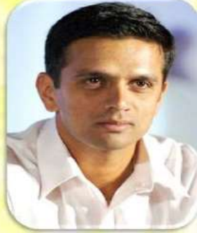
RAHUL DRAVID in conversation JAVAGAL SRINATH with