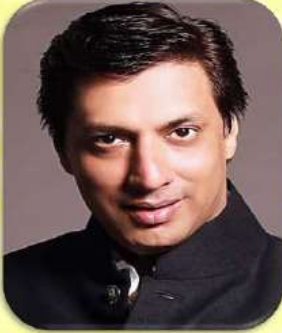
MADHUR BHANDARKAR Chief Guest (Three times National Award- winning Director)