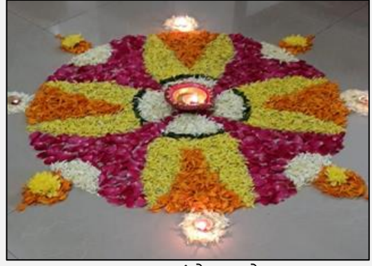
६. अलका कुंटे - पुकोलम