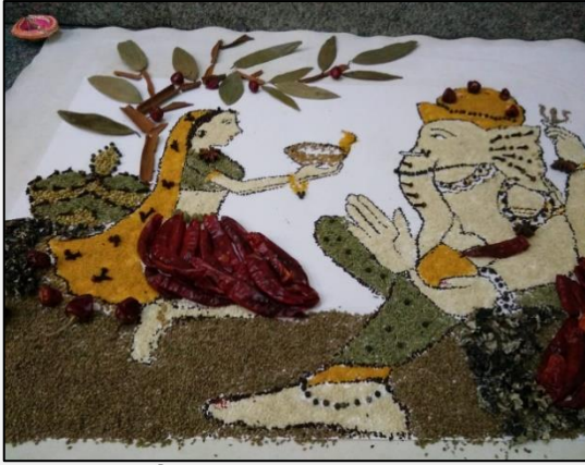
७. अंजना घैसास - मसाल्याचे पदार्थ वापरुन