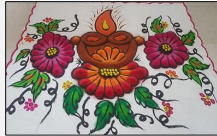
४. अश्विनी डोंगरे - ३ डी रांगोळी