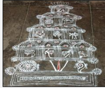
२. श्री मुळगुंद - विष्णूचे अवतार